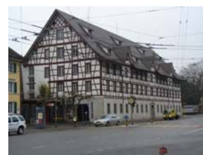
Kulturzentrum Alte Kaserne

2006 wurden 80 Eigenveranstaltungen durchgeführt. Bewährt haben sich einmal mehr die Veranstaltungsreihen, die im monatlichen Turnus organisiert werden. Auch in der Alten Kaserne war im Juni die Fussball-WM Trumppf. Die Nachwuchsband, die das musikalische Duell an der Jugendveranstaltung "tontraeger" gewonnen hat, konnte anschliessend live am Radio Stadtfilter auftreten und so neben ihrer ersten Bühnenerfahrung auch am Radio Neuland betreten.