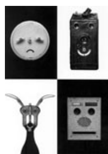
Gewerbemuseum Face to Face – Dinge haben ein Gesicht

Im Vergangenen Jahr präsentierte das Gewerbemuseum insgesamt 8 neue Ausstellungen. Grosse Beachtung in der Fachwelt fand die Ausstellung DesignLabor , welche vom 12. Mai bis 25. Juni 2006 auch noch im Kornhausforum in Bern präsentiert wurde. Ansonsten wurden viele Ausstellungen nur mässig besucht – vor allem UNIK: danish fashion , des Danish Design Centre, fand wenig Beachtung. Auf grosses Interesse, sowohl bei den Medien wie beim Publikum stiess Face to Face – Dinge haben ein Gesicht .