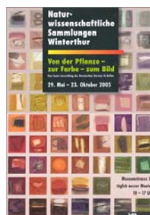
Von der Pflanze - zur Farbe - zum Bild

Die Museumsorganisation wurde angepasst und der traditionelle Fachbeirat aufgehoben.