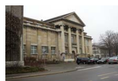
Museums- und Bibliotheksgebäude Museumstrasse 52

Nach einer Vielzahl von gescheiterten Versuchen in den letzten Jahrzehnten zur dringend notwendigen Sanierung und Erweiterung des Museums- und Bibliothekgebäudes wurden die Projektierungsarbeiten für dieses Gebäude abgeschlossen. Dem Grossen Gemeinderat wird 2007 eine Kreditvorlage unterbreitet. Die Erfahrungen der letzten Jahre haben gezeigt, dass diese Aufgabe für einen Architekturwettbewerb im herkömmlichen Sinne zu komplex ist. Das Vorgehen, in einem Auswahlverfahren ein Architekturbüro zu finden, das zusammen mit den Verantwortlichen der Stadt, den Institutionsleitern und der Denkmalpflege das Projekt gemeinsam entwickelt, hat sich als richtig erwiesen.