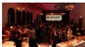
10. Internationale Kurzfilmtage Winterthur