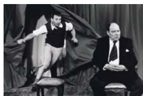
Theater Kanton Zürich Der Arzt wider Willen Komödie von Jean Baptiste Molière