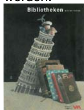
Leseförderungsmappe für Lehrpersonen "Bibliotheken machen Schule"

Neben der Reorganisation der Bibliothek Hegi als kombinierte Bibliothek und den erweiterten Angeboten der Integrationsbibliothek gelang es, 2006 einen dritten Meilenstein in der Leseförderung zu setzen. Nach drei-jähriger Arbeit wurde das Leseförderungs-paket für Schulen "Bibliotheken machen Schule" den Lehrpersonen vorgestellt. Die didaktisch aufbereiteten Bibliotheks-führungen, die Medienkisten für Klassen-projekte und die Kamishibai Lesetheater Angebote erfreuen sich seither grosser Beliebtheit und müssen bereits teilweise erweitert werden.