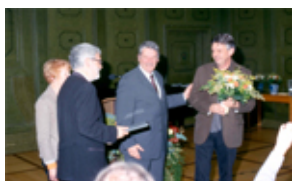
Prix Expo 2006 Die Akademie der Naturwissenschaften Schweiz (SCNAT) zeichnet das Naturmuseum mit dem Prix Expo 2006 aus.

Alle relevanten Angaben zu den Kulturveranstaltungen und der Kulturförderung sind umfassend im Internetportal der Stadt unter www.kultur.winterthur.ch abrufbar. Diese Informationsquelle wird rege benutzt und ist seit dem Oktober auch mehrsprachig aufgeschaltet worden. Die Informationen über Museen, Theater/Tanz, Musik/Konzerte, Film, Bibliotheken und Kulturzentren sind nebst Deutsch auch in Englisch, Französisch und Italienisch abrufbar.